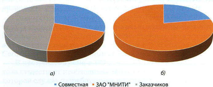
Рис. 1. Результаты инвентаризации объектов интеллектуальной собственности в 2010 г. (а) и в 2015 г. (б)

Правообладание объектами ИС. Результаты инвентаризации объектов интеллектуальной собственности в 2010 и 2015 г. приведены на рис. 1. Сопоставление диаграмм позволяет выявить тенденцию к отказу заказчиков от правообладания патентами. Причина тому не столько необходимость оплаты пошлин за поддержание патентов, сколько сложность выполнения обязательств по их внедрению и эффективному использованию.